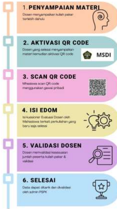
Gambar 1. Alur Presensi Kuliah Pakar QR Code